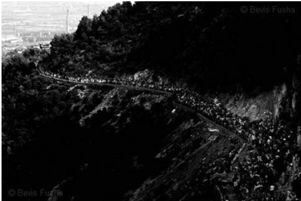
Pilgrims in Shna Ndo, Laç, Albania