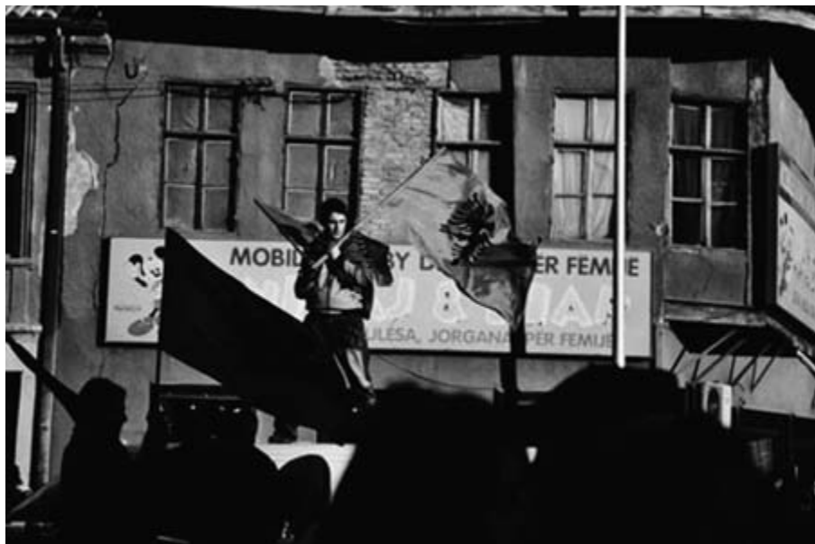
Kosovo Independence Day, 17 February 2008

Kinema ‘Millenium’ shfaq filmin ‘Letra fatale’. Ky është një film mbi rininë dhe problemet e sotme sociale. Në qendër është jeta dhe fati i dy të rinjve. Filmi është prodhim i Radio-Televizionit Shqiptar.