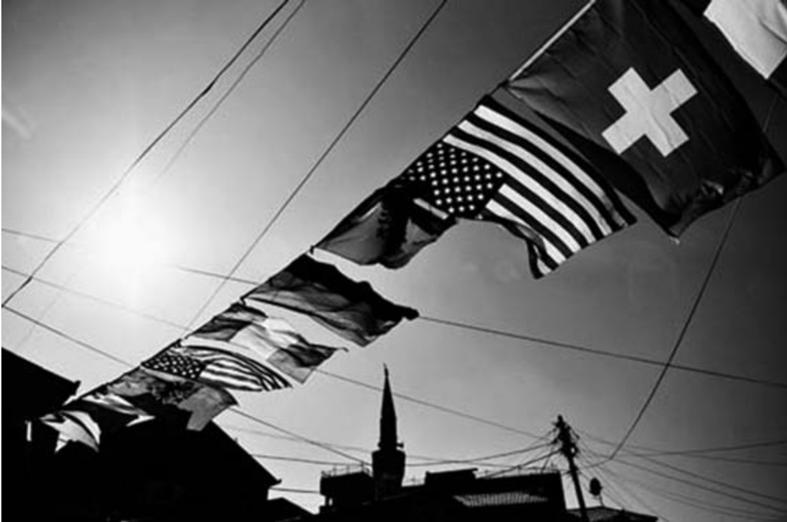
Prishtina, Kosovo, February 17, 2008. Flags of nations that have supported the independence of Kosovo.