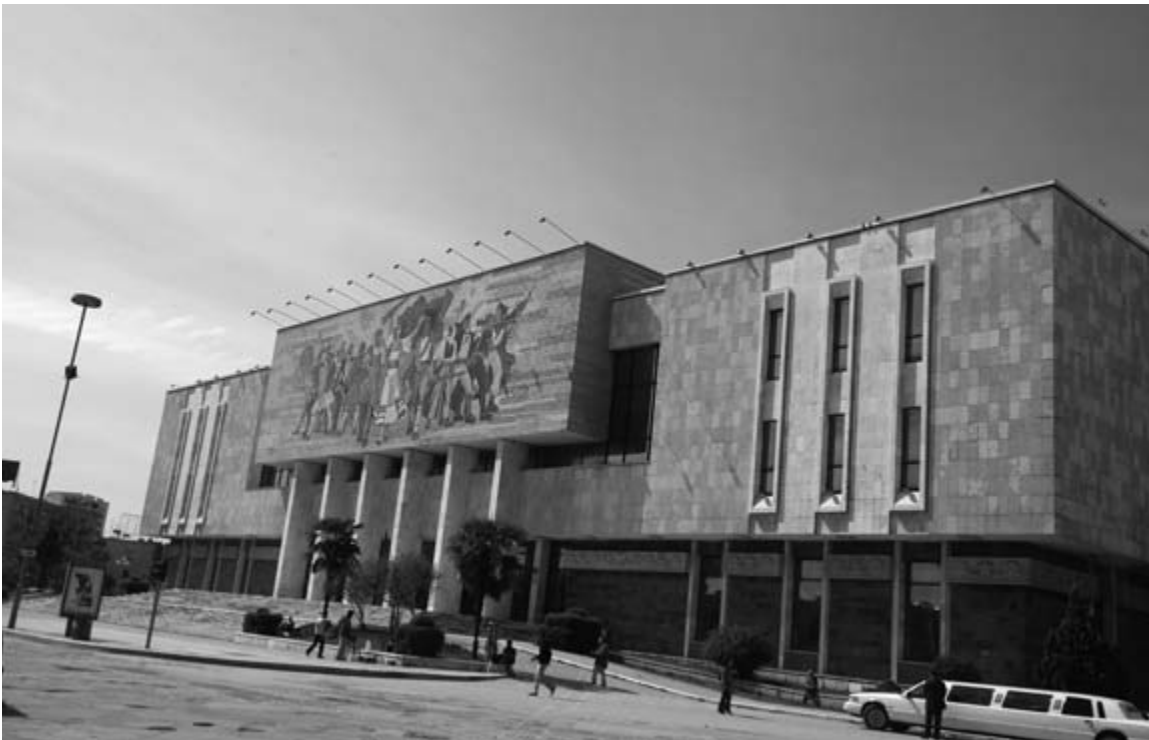
National History Museum, Tirana