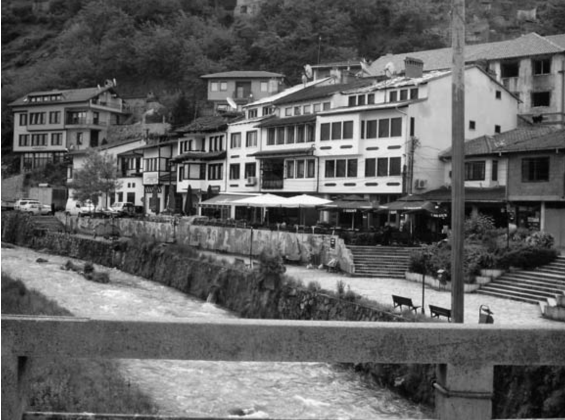
Prizren, Kosovo