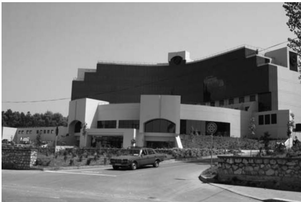
Hotel Sheraton, Tirana