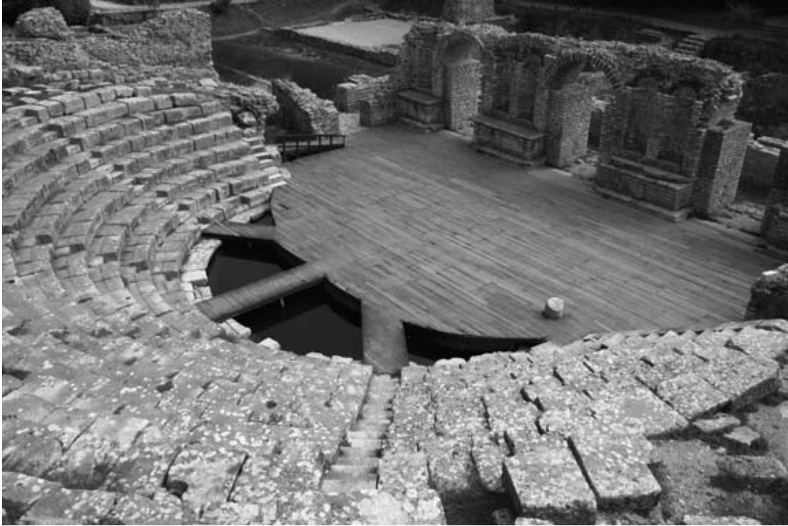
The theater at Butrint