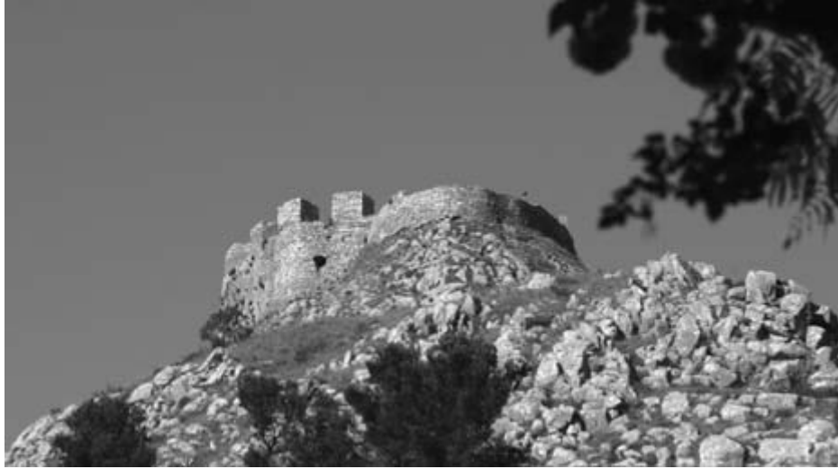
Rozafat Castle, Shkodër, Albania