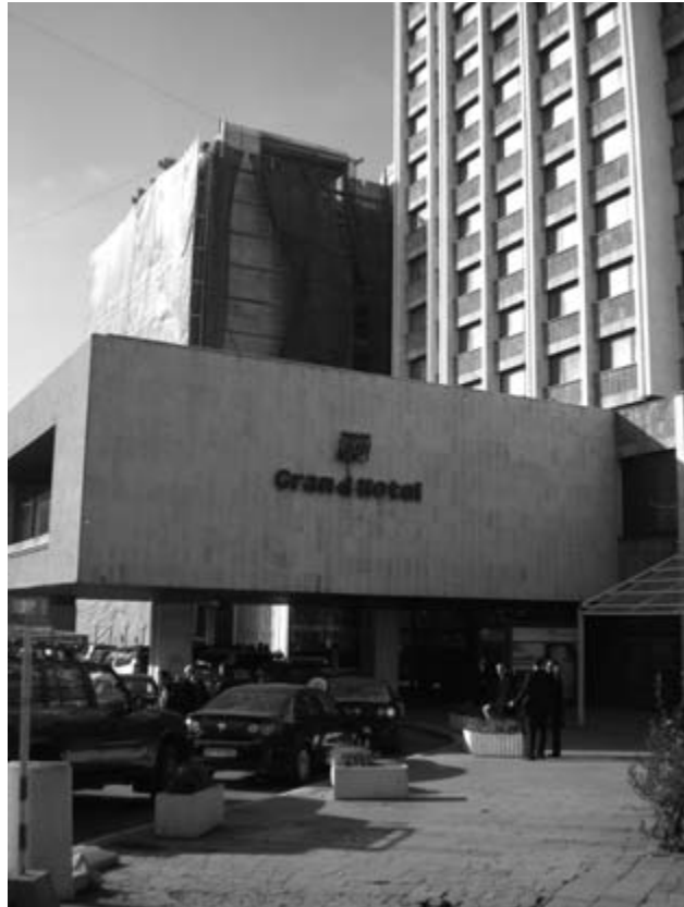
Grand Hotel in Prishtina