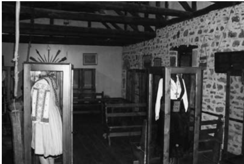
Albanian traditional dresses