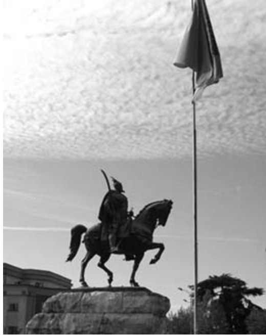
Gjergj Kastrioti-Skanderbeg