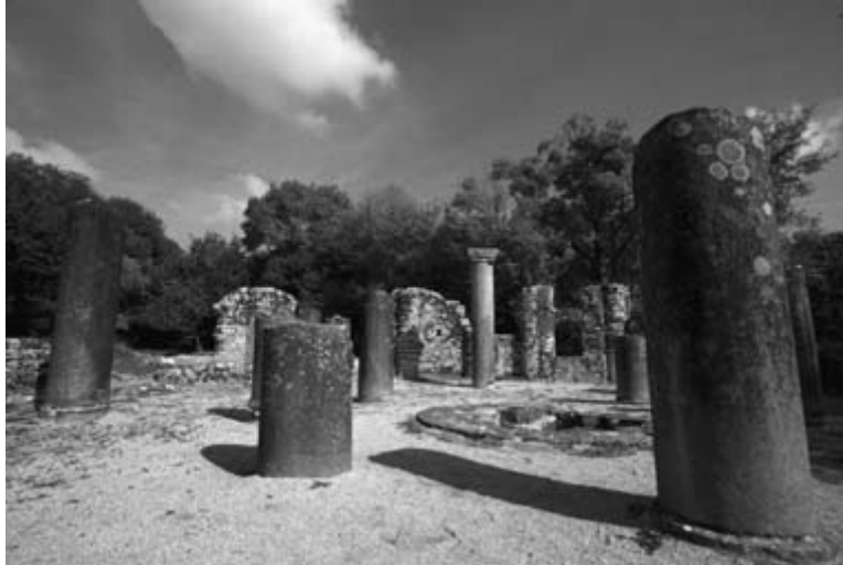
Sixth-century baptistery, Butrint