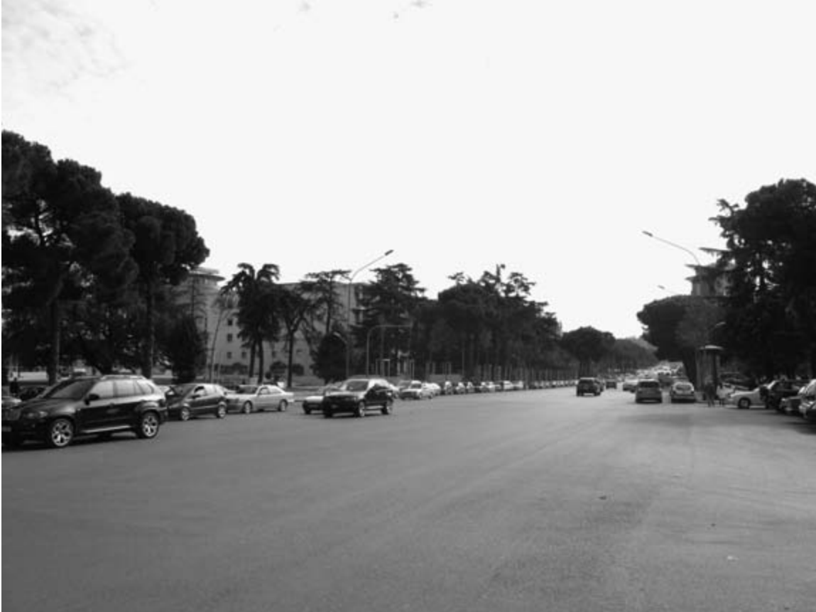
The boulevard Dëshmorët e Kombit (Martyrs of the Nation), Tirana

beans ( bizele ), cucumbers ( tranguj ), garlic ( hudhra ; lit., garlicks), and onions ( qepë ) can be found year-round.