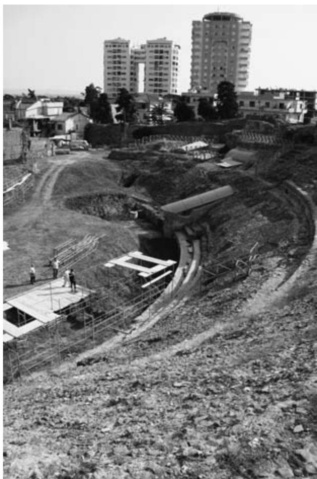
Durrës amphitheater, Albania